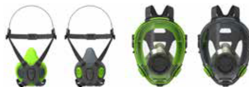
Respiradores semi faciales BLS 4000 S - BLS 4000R Respiradores de cara completa BLS 5700 - BLS 5600