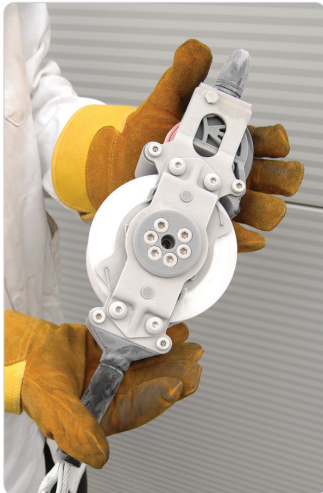
Funciona en condiciones bajo cero