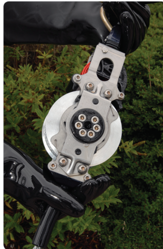
Puede soportar contaminantes