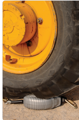
Carcasa resistente a impactos

Probado a una temperatura de operación de -22°F to +129°F (-30°C to +54°C).