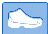
RESISTENTE A IMPACTOS