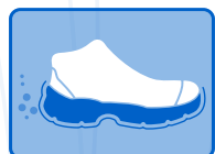
RESISTENTE A LOS Y SUS DERIVADOS HIDROCARBUROS