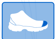
PUNTERA DE ACERO